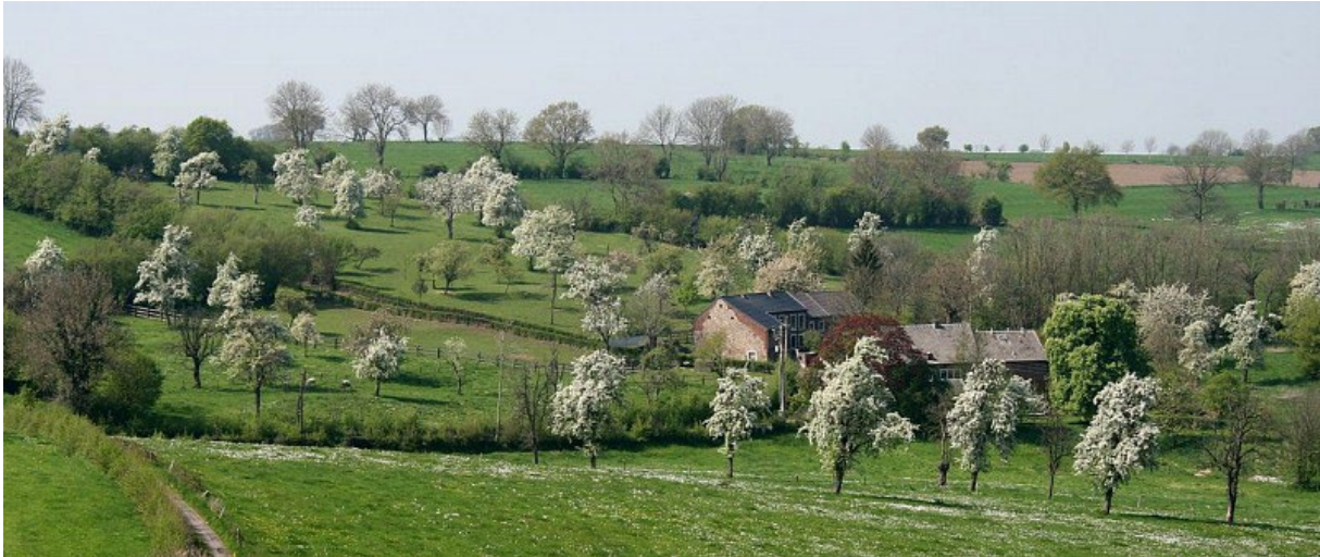
(Bocage: weiden en fruitbomen)

De Moulin de Val Dieu (klik hier ), gelegen tegenover de gelijknamige abdij, verwelkomt ons voor de lunchpauze. Bierliefhebbers kunnen het gerstenat proeven dat in de abdij wordt geproduceerd (klik hier ). Wie dat wenst, kan een omweg maken naar de abdiwinkel die lokale producten aanbiedt.