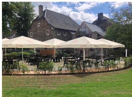
(Abdij van Val Dieu en molen van Val Dieu)

De namiddag staat in het teken van de ontdekking van enkele van de mooiste dorpen van Wallonië: Clermont-sur-Berwinne, Olne, Soiron, enkele parels van deze coulisselandschapsstreek.